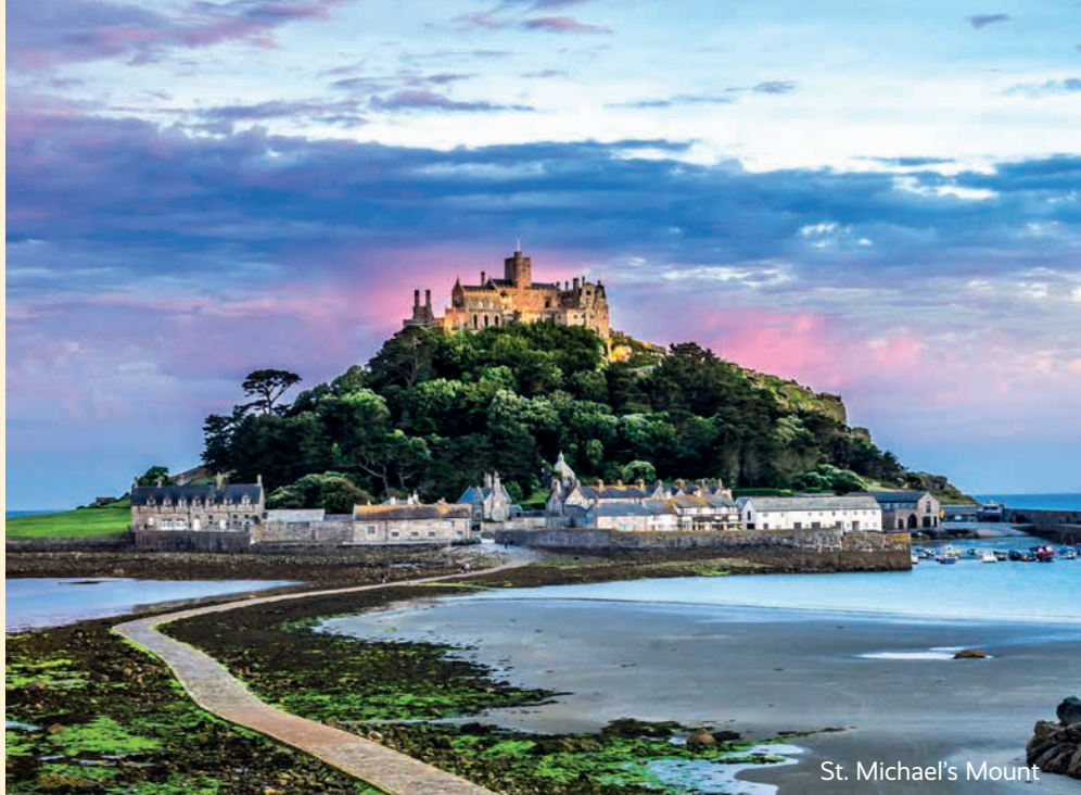
St. Michael's Mount